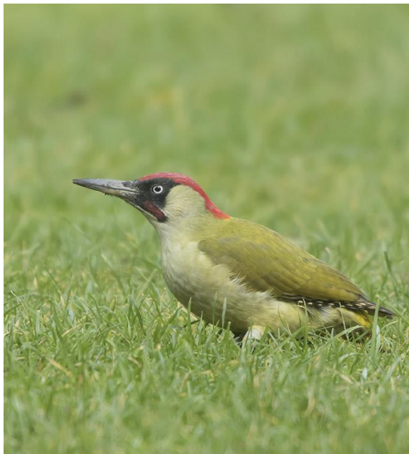
Groene specht - Picus viridis - Spechten ( Picidae )

Op de Domburgsche broeden meestal 3 à 4 paren per jaar, waaronder altijd een paar op het dak.