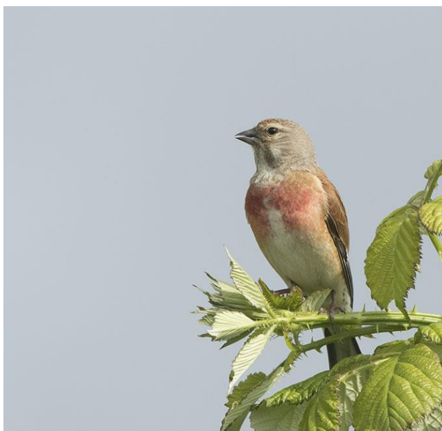
Kneu - Carduelis cannabina - Vinken ( Fringillidae ) Rode lijst

Bij slechter weer vaak op fairways 4 en 6 in groepen van zo'n 20 vogels, soms een paartje op de fairway van hole 9. De meeste kans op het weiland aan de overkant van de Schelpweg en dan in enorme aantallen, tussen de Kieviten.