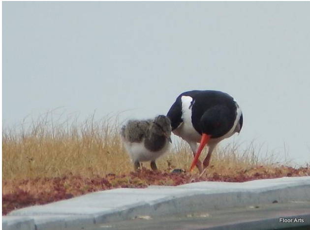
Scholekster - Haematopus ostralegus - Scholeksters ( Haematopodidae )

Een koppeltje patrijzen werd tot rond 2016 een enkele maal per jaar gezien en dan vooral achterin de baan bij hole 5.