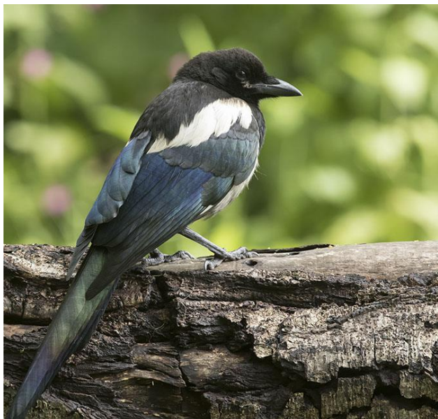
Ekster - Pica pica - Kraaien ( Corvidae )

Eksters zijn intelligente vogels met een fascinerende leefwijze. Tot hun derde levensjaar leven eksters in 'jeugdbendes', daarin doen ze de ervaring op die een ekster nodig heeft om jongen groot te kunnen brengen. Eksters eten wat ze kunnen vinden: het grootste deel van hun menu bestaat uit emelten, kevers, regenwormen en menselijk afval als patat en brood. Vooral in het broedseizoen, wanneer de eksters zelf jongen hebben, vullen ze hun dieet nog aan met eitjes van andere vogels en soms ook jonge vogels. De ogenschijnlijk zwart-wit gekleurde vogel blijkt bij nauwkeuriger kijken een bont palet aan metallic-kleuren te vertonen. Eksters staan er in de volksmond om bekend glimmende voorwerpen als sierraden en zilveren theelepeltjes te 'stelen' en naar het nest te brengen. Dit gedrag komt voort uit de onverzadigbare nieuwsgierigheid van eksters; alles dat er 'anders' uitziet, wordt onderzocht en eventueel begraven onder enkele bladeren voor later gebruik.