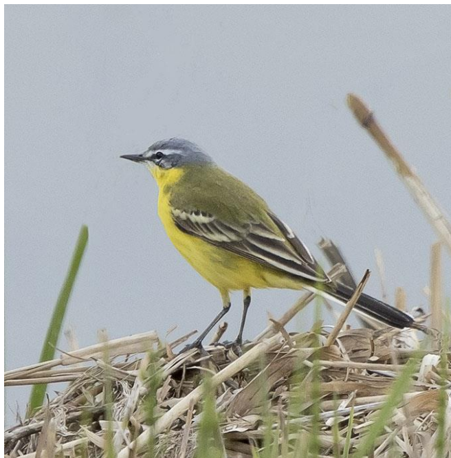
Gele kwikstaart - Motacilla flava - Kwikstaarten ( Motacillidae ) Rode lijst

Hele vrolijke groepjes, vaak te zien in de bosjes langs hole 2.