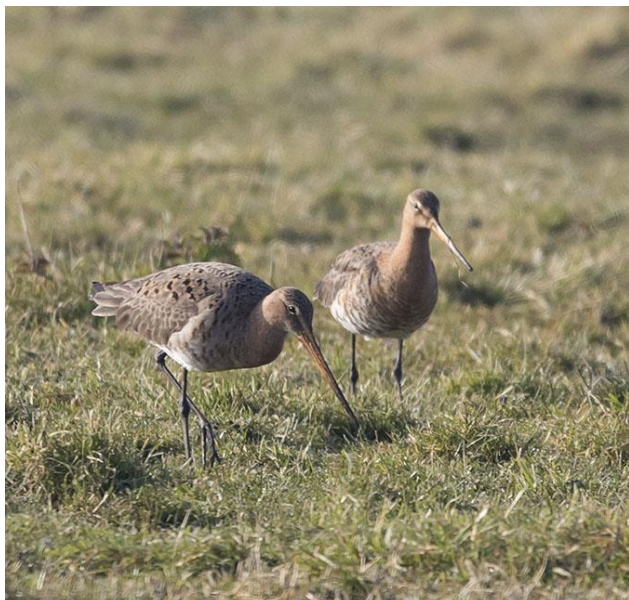
Grutto - Limosa limosa - Strandlopers ( Scolopacidae ) Rode lijst

De grutto is een oer-Hollandse weidevogel. Nog wel. Want de natuurwaarden van het agrarisch land staan zwaar onder druk. Waar het boerenbedrijf nog ruimte laat voor natuur, daar gedijt de grutto. Zo is hij de ambassadeur van agrarisch land waar productie en natuur in balans zijn. Nergens in Europa broeden zoveel grutto's als in Nederland. In 2016 is de grutto door het Nederlandse publiek uitgekozen tot nationale vogel.