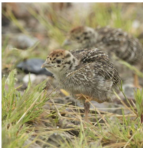
Patrijs en kuikens - Perdix perdix - Hoenders ( Phasianidae ) Rode lijst

Patrijzen zijn standvogels (die bij het broedgebied blijven overwinteren) van open agrarisch gebied, heidevelden en hoogvenen. Oorspronkelijk waren het steppebewoners, maar de soort heeft zich erg goed aangepast aan het leven in kleinschalig agrarisch landschap. In Nederland komt de patrijs verspreid voor. Akkerland is het meest in trek, vooral als dit wordt afgewisseld met ruige dijken, slootranden, wegbermen en houtwallen. Patrijzen eten zowel plantaardig als dierlijk voedsel, maar de jongen leven de eerste weken louter van insecten en ander klein gedierte. De patrijs is altijd een favoriet doelwit geweest voor jagers, maar die hebben de jacht op de soort moeten staken. Het aantal patrijzen neemt, door schaalvergroting in de landbouw, dramatisch af.