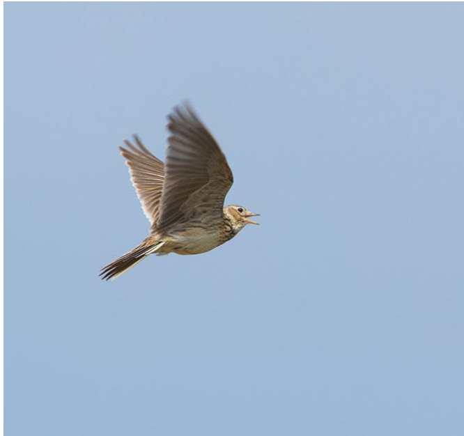
Veldleeuwerik - Alauda arvensis - Leeuweriken ( Alaudidae )

Bij ons te zien in en bij de bosjes naast de rode tee van hole 9.