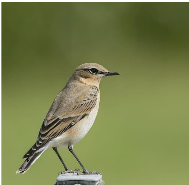
Tapuit - Oenanthe oenanthe - Vliegenvangers (Muscicapidae) Rode lijst

Tapuiten zijn op de grond levende vogels in de omgeving van duinen en heidevelden, in het buitenland ook van droge graslanden, hoogvenen, rotsige hellingen en toendra's. Tapuiten broeden in holen, vaak een konijnenhol. Het uit insecten en ander klein gedierte bestaande voedsel wordt liefst op schaars begroeide, insectenrijke plaatsen verzameld. Tapuiten zijn trekvogels en overwinteren op de Afrikaanse savannen.