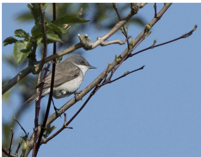
Braamsluiper - Sylvia curruca - Grasmussen (Sylviidae)

Rode lijst wil zeggen dat het een met uitsterven bedreigde soort is.