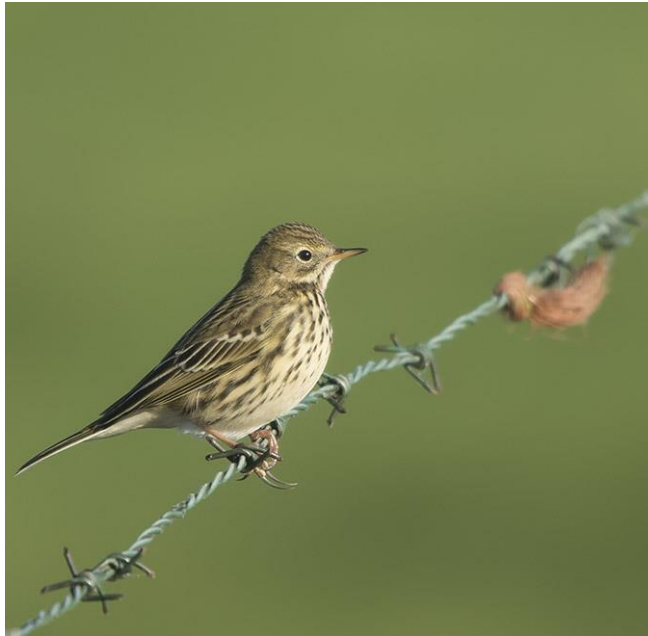
Graspieper - Anthus pratensis - Kwikstaarten ( Motacillidae ) Rode lijst

Op de Domburgsche zien we een afname van het aantal broedparen (vos!), maar begin 2016 zagen we toch nog 2 paren met jongen helemaal rechts in de hoek aan het begin van de eerste hole en ook in 2023 was dat het geval en wel op dezelfde plek.