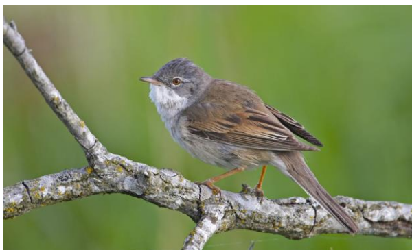
Grasmus - Sylvia communis - Grasmussen ( Sylviidae )

De grasmus is geen opvallende vogel, maar de zang en de zangvlucht wel. Grasmussen zijn 'pioniervogels' van de allereerste bosstadia, met opslag van struweel, in allerlei landschappen. Soms ook in pure ruigte met alleen hoge kruiden te vinden. Ondanks zijn naam is de grasmus niet nauw verwant aan de huismus. De 'familie' van de grasmussen is vooral een in het zuiden van Europa en in Afrika voorkomende groep vogels. Hiervan heeft de grasmus veruit het grootste verspreidingsgebied.