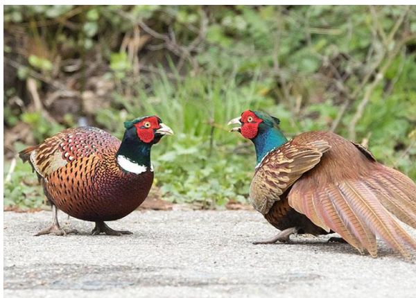
Fazant - Phasianus colchicus - Hoenders ( Phasianidae )

Op de Domburgsche door de hele baan, met broedparen achter de 5 de green.