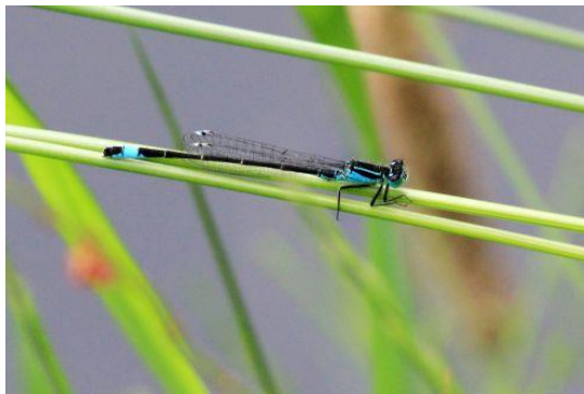
Lantaarntje - Ischnura elegans - (mannetje)

33 – 40 mm. Vliegtijd juni tot september. In het voorjaar komen zwervende heidelibellen vanuit Zuid-Europa naar Nederland en vindt hier voortplanting plaats. De meeste larven sluipen in de zomer van datzelfde jaar nog uit. Sommige halen dat niet en moeten overwinteren. Habitat: ondiepe zandige plassen met weinig vegetatie. Dit zijn vaak pas gegraven plassen die in de zomerperiode uitdrogen. Het is een vrij algemene soort.