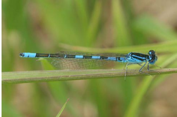
Gaffelwaterjuffer - Coenagrion scitulum - (mannetje)

30 – 33 mm. Kleine waterjuffer met blauw en zwart op het achterlijf. Zeer zeldzaam en vrij nieuw in Nederland. Er zijn nog niet veel Nederlandse gegevens bekend. Habitat stilstaand en zwak stromend water in de zon, met veel water- en oeverplanten.