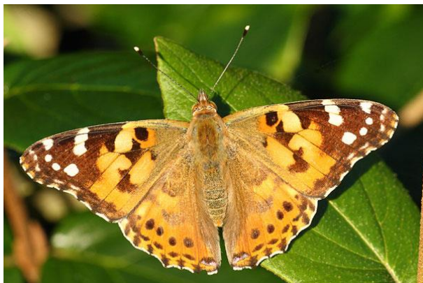
Distelvlinder - Vanessa cardui -

Spanwijdte 50 – 60 mm. Vliegtijd van mei tot oktober in twee generaties. Overwintering als vlinder. De vlinder varieert heel sterk in grootte en de rups leeft op brandnetels in de nabijheid van water.