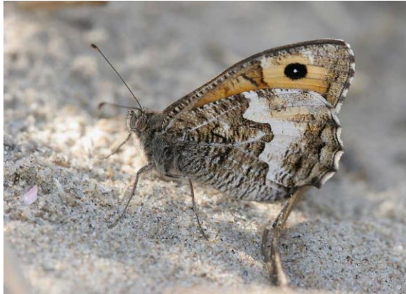
Heidevlinder - Hipparchia semele -

obstakels heen, in tegenstelling tot standvlinders die er omheen vliegen. Is groter dan de Kleine vos en lichter van kleur. Let op de vijf oogvlekken op de onderzijde van de vleugels.