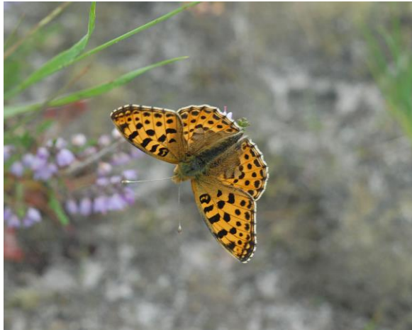
Kleine parelmoervlinder - Issoria lathonia -

Spanwijdte 35 – 45 mm. Vliegtijd van mei tot oktober in meerdere generaties. Overwintering als rups, pop of vlinder!, maar in Nederland alleen als rups. De buitenrand van de voorvleugel is duidelijk naar binnen gebogen. Het is een trekvlinder die wel naar Engeland en Noord-Scandinavië vliegt.