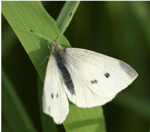
Klein koolwitje - Pieris rapae -

Spanwijdte 40 – 50 mm. Vliegtijd van maart tot oktober in meerdere generaties. In grootte en tekening sterk van elkaar verschillend. Overwintering als pop. Het mannetje heeft één, het vrouwtje twee geïsoleerde zwarte vlekken op de voorvleugels. De vlek aan de vleugelpunt is lichter (grijs, niet zwart) dan bij het Grote koolwitje. Het is de algemeenste dagvlinder.