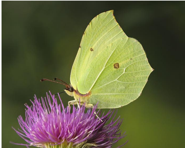
Citroenvlinder - Gonepteryx rhamni -

Spanwijdte 50 – 55 mm. Vliegtijd van februari tot oktober in één generatie. Overwintering als vlinder dicht boven de grond. Bij voorkeur langs bosranden; op de baan slechts enkele keren waargenomen.