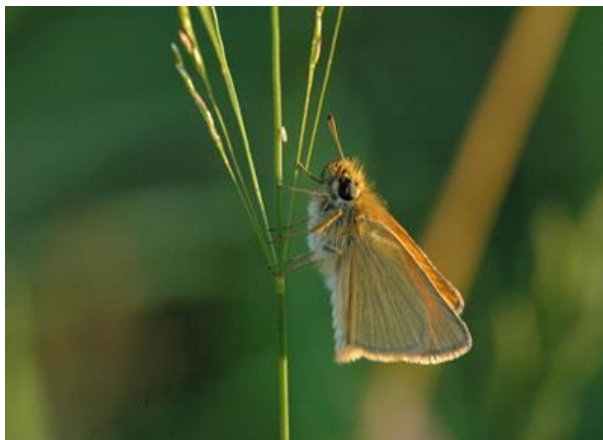
Zwartspietdikkopje - Thymelicus lineola -

Spanwijdte 32 – 42 mm. Vliegtijd van maart tot oktober in meerdere generaties. Overwintering als rups. De eerste mannetjes verschijnen vroeger dan de eerste vrouwtjes. Mannetje met eenkleurige bruine bovenzijde en vrouwtje met roodbruine band.