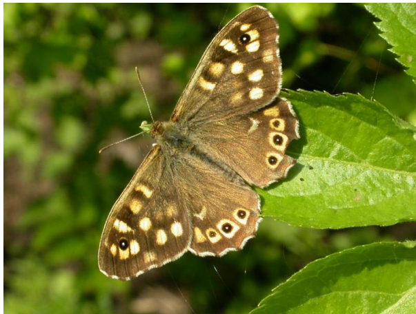
Bont zandoogje - Pararge aegeria -

Spanwijdte 30 – 38 mm. Vliegtijd van juni tot augustus in één generatie. Overwintering als rups. Heeft bij de vleugelpunt een dubbele oogvlek.