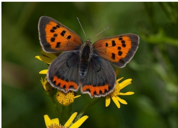
Kleine vuurvlinder- Lycaena phlaeas -

Spanwijdte 40 – 50 mm. Vliegtijd van februari tot oktober in meerdere generaties. Overwintering als vlinder. Onderzijde grijsbruin met lichte band op de achtervleugels. Let op de blauwe vlekjes langs de rand op bovenzijde van de achtervleugels.