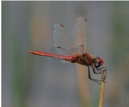
Zwervende heidelibel - Sympetrum fonscolombii - (mannetje)