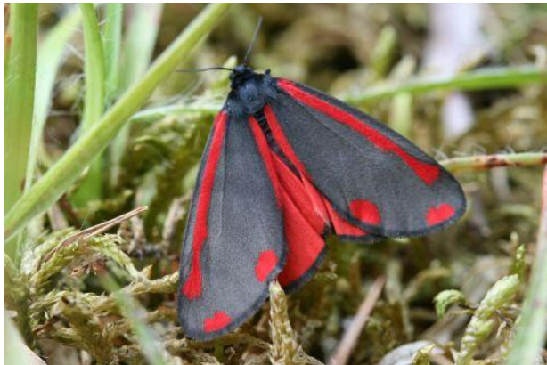
Sint Jacobsvlinder - Thyria jacobaea -

Spanwijdte 18 – 42 mm. Vliegtijd van april tot oktober in meerdere generaties. Overwintert als rups. Bij het bruine vrouwte zijn alleen de vleugelwortels meer of minder blauw bestoven.