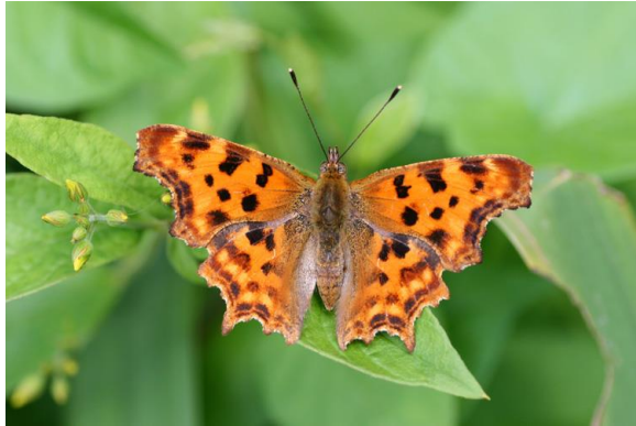
Gehakkelde aurelia - Polygonia c-album -

Vliegtijd van maart tot november in meerdere generaties. Rups leeft op brandnetels. Overwintert als vlinder. Vliegt zelfs bij bewolkt weer en regen.