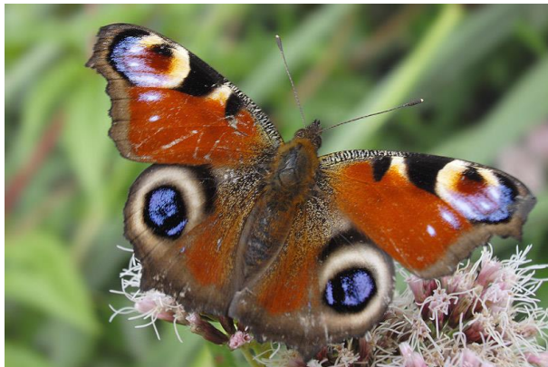
Dagpauwoog - Inachis io -

Spanwijdte 50 – 55 mm. Vliegtijd van februari tot oktober in één generatie. Overwintering als vlinder dicht boven de grond. Bij voorkeur langs bosranden; op de baan slechts enkele keren waargenomen.