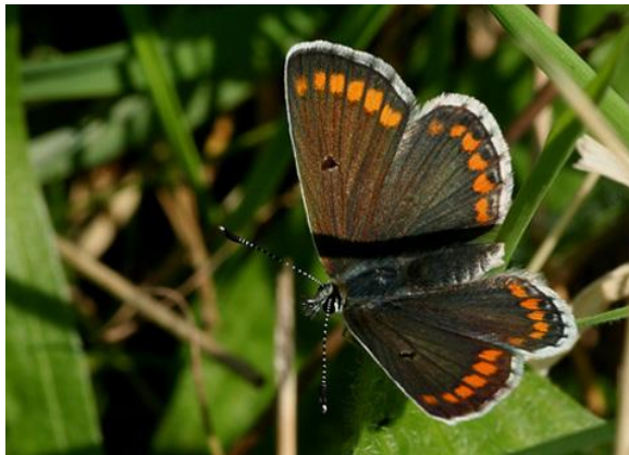
Bruin blauwtje - Aricia agestis -

Spanwijdte 48 – 55 mm. Vliegtijd van maart tot oktober in twee generaties. Overwintering als vlinder. Op de onderzijde altijd een duidelijke witte C. De vleugels zijn sterk ingesneden. Meestal in het struikgewas.