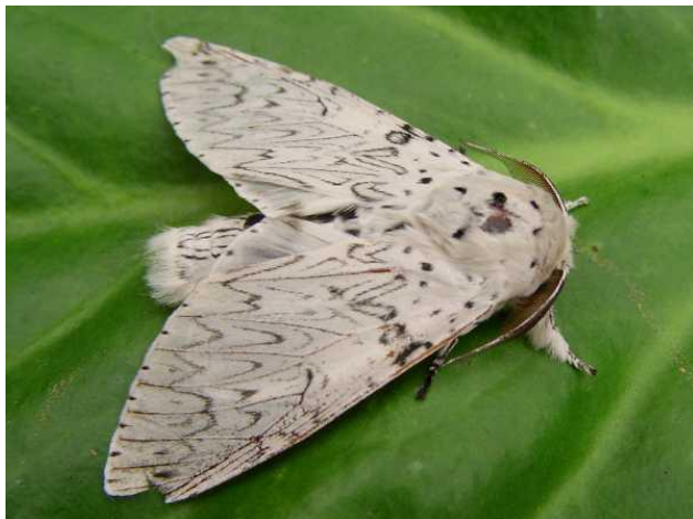
Hermelijnsvlinder - Cerura vinula -

Spanwijdte 30 – 34 mm. Vliegtijd van juni tot september in één generatie. Overwintering als rups. De vlinder gaat graag met samengeklapte vleugels op de kale grond of op een steen zitten, waar hij dan uitstekend gecamoufleerd is.