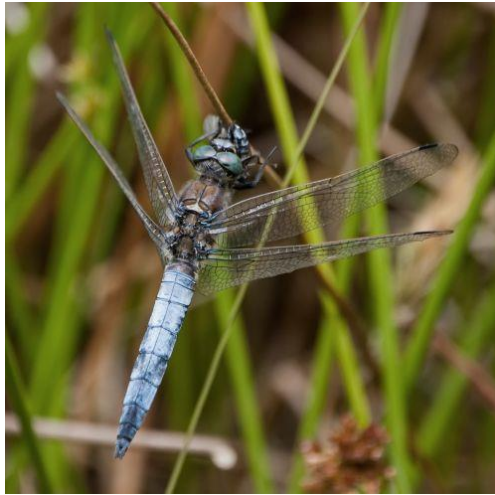
Gewone Oeverlibel - Orthetrum cancellatum - (mannetje)