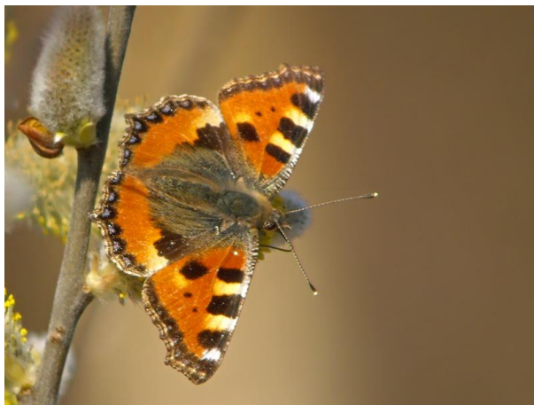
Kleine vos - Aglais urticae -

Spanwijdte 35 – 45 mm. Vliegtijd van mei tot oktober in meerdere generaties. Overwintering als rups, pop of vlinder!, maar in Nederland alleen als rups. De buitenrand van de voorvleugel is duidelijk naar binnen gebogen. Het is een trekvlinder die wel naar Engeland en Noord-Scandinavië vliegt.