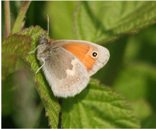
Hooibeestje - Coenonympha pamphilus -

Spanwijdte 28 – 35 mm. Vliegtijd juni en juli in één generatie. Overwintering als rups. De bovenzijde is eenkleurig oranjebruin, maar je ziet meestal de onderzijde. Meest voorkomend in de vochtigere delen van de baan.