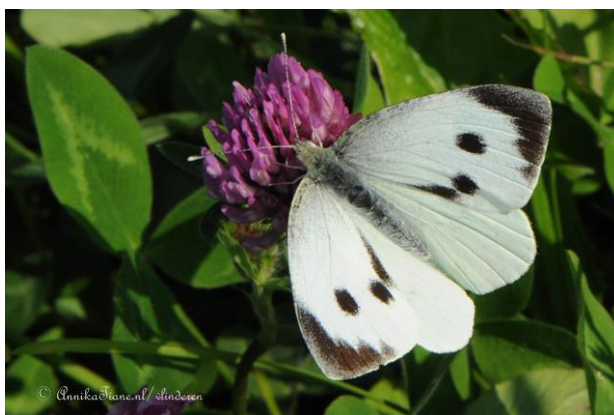
Groot koolwitte - Pieris brassicae -

Spanwijdte 32 – 42 mm. Vliegtijd van mei tot september in twee generaties. De zwart-gele rups leeft op Jacobskruiskruid. Overwintering als pop. Let op de draadvormige sprieten. Het is een overdag vliegende nachtvlinder.