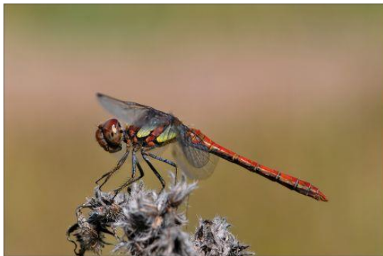
Bruinrode heidelibel - Sympetrum striolatum - (mannetje)

30 – 33 mm. Kleine waterjuffer met blauw en zwart op het achterlijf. Zeer zeldzaam en vrij nieuw in Nederland. Er zijn nog niet veel Nederlandse gegevens bekend. Habitat stilstaand en zwak stromend water in de zon, met veel water- en oeverplanten.