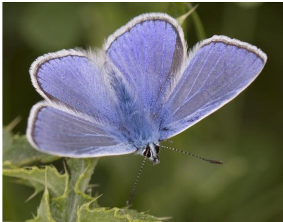
Icarus blauwtje (mannelijke) - Polyommatus icarus -

Spanwijdte 28 – 35 mm. Vliegtijd juni en juli in één generatie. Overwintering als rups. De bovenzijde is eenkleurig oranjebruin, maar je ziet meestal de onderzijde. Meest voorkomend in de vochtigere delen van de baan.