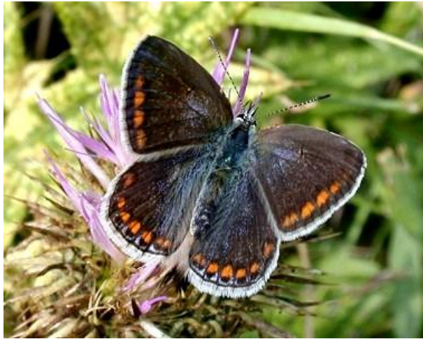
Icarus blauwtje (vrouwte) - Polyommatus icarus -

Spanwijdte 18 – 42 mm. Vliegtijd van april tot oktober in meerdere generaties. Overwintert als rups. Bij het bruine vrouwte zijn alleen de vleugelwortels meer of minder blauw bestoven.