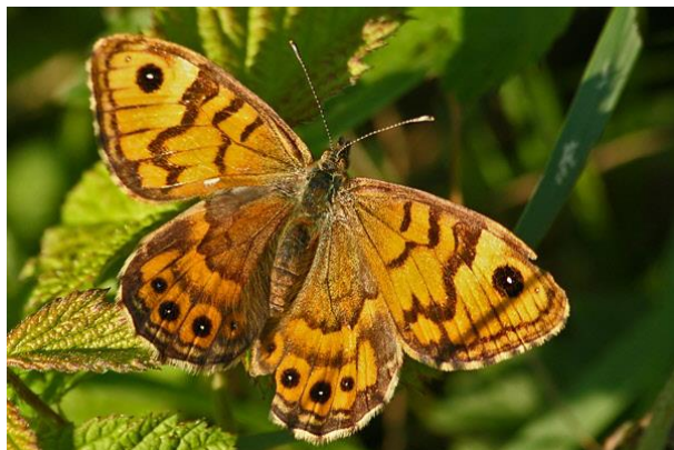
Argusvlinder - Lasiommata megera -

Spanwijdte 35 – 45 mm. Vliegtijd van april tot september. Overwintering als rups. De vlinders gaan graag met samengeklapte vleugels op stenen (duinpad) zitten, waarop ze dan uitstekend gecamoufleerd zijn.