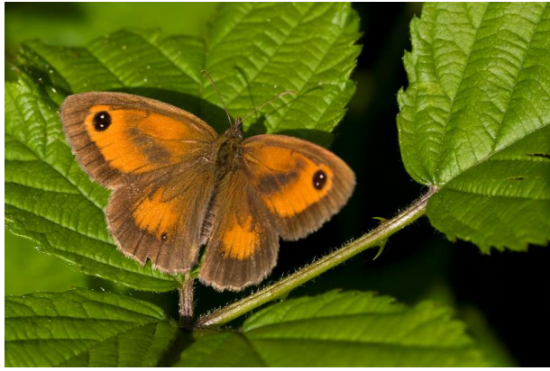
Oranje zandoogje - Pyronia tithonus -

Spanwijdte 30 – 38 mm. Vliegtijd van juni tot augustus in één generatie. Overwintering als rups. Heeft bij de vleugelpunt een dubbele oogvlek.