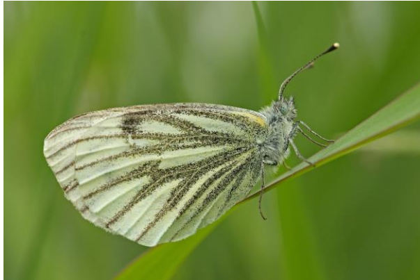
Klein geaderd witje - Pieris napi -

Spanwijdte 23 – 30 mm. Vliegtijd van februari tot november in meerdere generaties. Overwintering als rups.