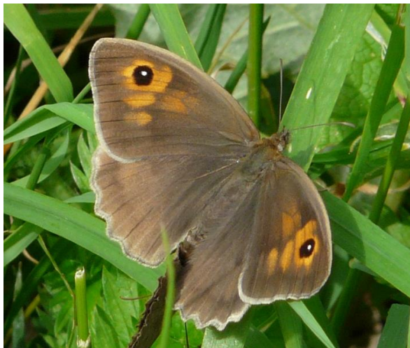
Bruin zandoogje - Manolia jurtina -

Spanwijdte 50 -65 mm. Vliegtijd van maart tot oktober in meerdere generaties. Overwintering als pop. De aderen op de onderzijde zijn altijd breed grijsgroen omzoomd. Het is één van de eerste voorjaarsvlinders, maar op onze baan slechts sporadisch aangetroffen.